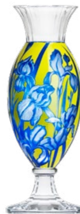
váza / ryt. Kosatce křišťál přejímaný modrou a žlutým emailem 16,4 × 50 cm 51192 unikát