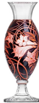
váza / ryt. Durman křišťál přejímaný oranžovým emailem a modrou 16,4 × 50 cm 51190 unikát