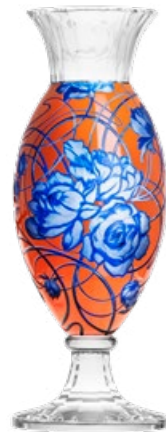
váza / ryt. Pivoňky křišťál přejímaný modrou a oranžovým emailem 16,4 × 50 cm 51191 unikát

Trojice váz, z nichž každá existuje pouze v jednom jediném exempláři, navazuje na cyklus váz s florálními motivy Alfonse Muchy, jimiž Moser oslavuje 160. výročí narození tohoto umělce v roce 2020. Vynikají odlišnou kombinací barev a také motivy, které se soustředí na vybrané květiny bez ženských figur – včetně neobvyklého, čarovného květu durmanu. Jedná se o sběratelské kusy.